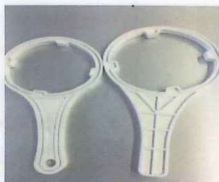
・セディメントレンチ